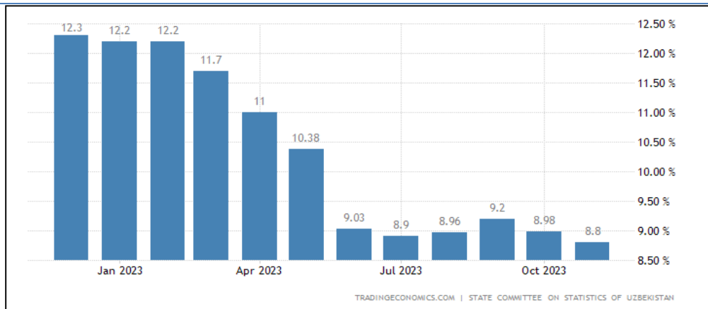
Рис 2. Эффективность принятых мер и их влияние на экономику Узбекистана в период пандемии.

В начале пандемии COVID-19 правительство Узбекистана столкнулось с серьезными вызовами, включая угрозу инфляции из-за нестабильности на мировых рынках и сокращения международной торговли. В ответ на эти вызовы, правительство предприняло несколько ключевых мер, направленных на сдерживание инфляции.