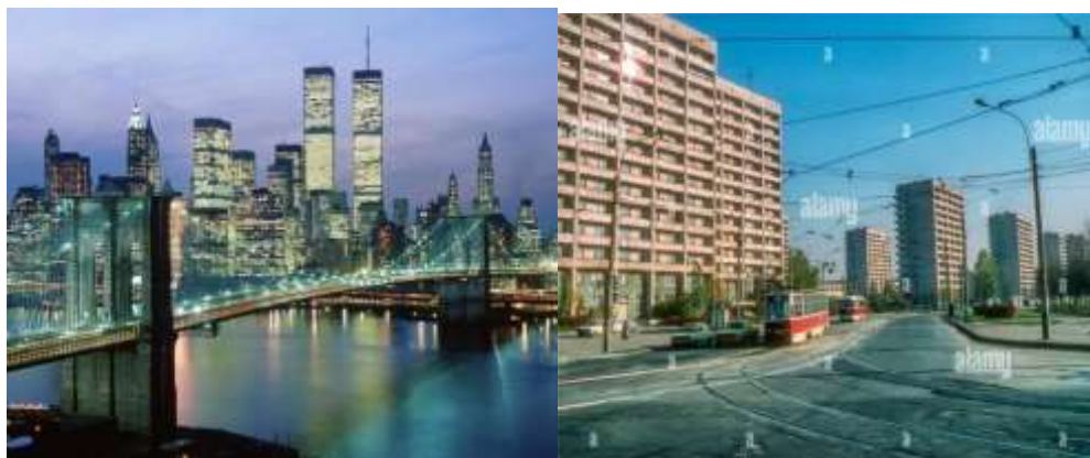
Nyu-York shahri 1980-yillarda

Yuqorida iqtisodiy o'sishning ekstensiv va intensiv turlari SSSR va G'arb mamlakatlari misolida ko'rib chiqildi. Bu davlatlarda iqtisodiy siyosat yuritishning asosiy tamoyillarini belgilab bergan bir qancha normativ hujjatlar borki, ularni ta'kidlamay iloj yo'q. Bu o'rinda Iosif Stalin davrida boshlanib, rejalashtirilgan iqtisodiy siyosat yuritish tamoyilini davlatning iqtisodiy sektorida hukmron prinsipga aylantirgan besh yillik rejalarni ta'kidlash lozim. Ulardan birinchisi 1928-yilda qabul qilingan Birinchi besh yillik reja (1928-1932) edi. Bu va boshqa shu kabi sovetlar tomonidan qabul qilingan iqtisodiy doktrinalar o'z xarakteriga ko'ra iqtisodiy o'sishga mavjud resurslardan oqilona foydalanish orqali emas, balki yangilarini o'zlashtirish bilan erishishga qaratilgan edi. Sovet davlati bilan parallel o'tkazadigan bo'lsak aynan shu davrda AQSHda Yangi iqtisodiy siyosat (New deal) nomli iqtisodiy strategik dastur ishlab chiqilib uning AQSH iqtisodini buyuk depressiyadan olib chiqishda ahamiyati beqiyos edi 5 . Sababi mazkur dastur AQSHni o'z ichki resurslaridan samarali foydalanishini va texnik taraqqiyotni qo'llab quvvatlashi bilan ahamiyatli edi. AQSHda keyinchalik ham qabul qilingan