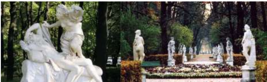
Скульптуры элементы народной традиции

Народные традиции сыграли немалую роль в садово-парковом искусстве.