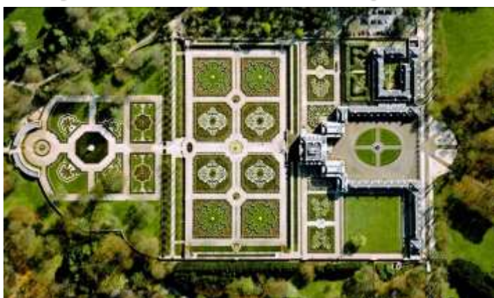
Генплан Версальского дворца. Планировка парка

Примером может служить обширная работа Андре Ленотра для короля Франции Людовика XIV в Версальском дворце. [1]