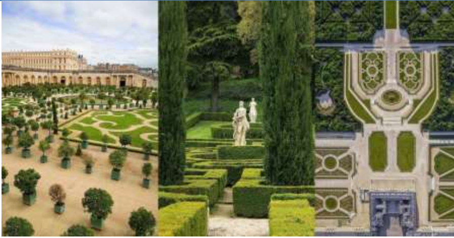
Версальский дворец Франция

Народные традиции сыграли немалую роль в садово-парковом искусстве.