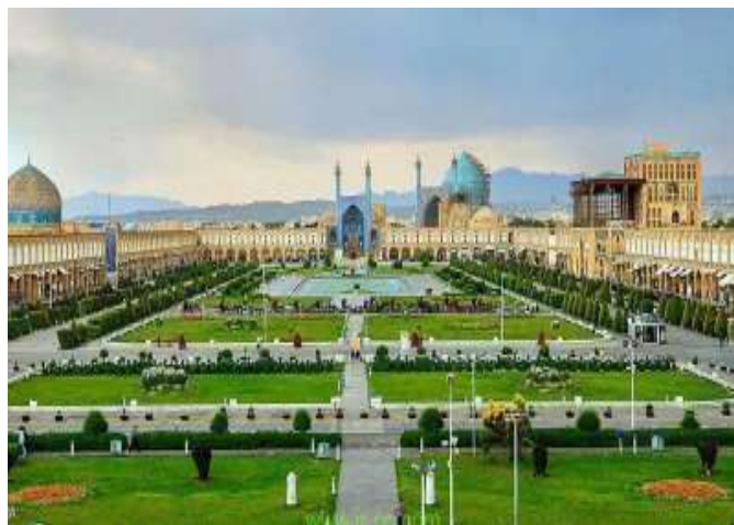
Чорбог в Исфахане