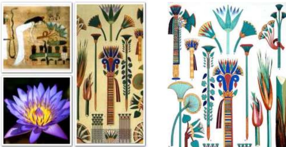
Древнегреческий орнамент с чередованием лотосов и пальметт

В древнем Египте - это были лотос и финиковая пальма. Стебли первого шли в пищу бедняков, а плоды второго - спасали путника в пустыне. А в Древнем Китае - бамбук утолял голод и ценился как дешевый строительный материал. Данные примеры указывают на утилитарные и практические применения флоры.